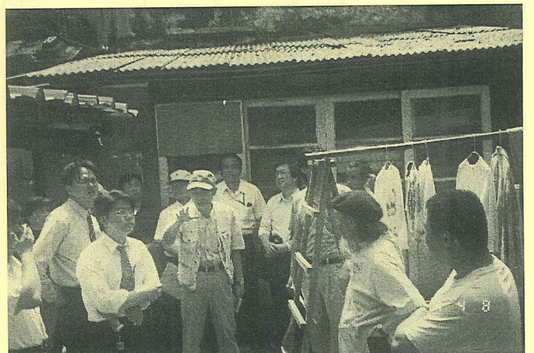
台北縣政府工務局4月8日到重建街進行拓寬工程會勘

整個會勘活動進行將近兩個小時，對重建街拆遷的意見持正反兩面都有，部份居民認為，歷史建築年久失修面貌、已不復呈現，道路拓寬可便利翻修改建大樓，且緊急救難措施得以深入住宅區；也有部份居民憂心，道路開闢將帶給重建街更多塞車、停車、噪音、廢氣污染等問題。文史團體提出，祖師廟是淡水最重要的信仰之一，目前寺裡的寧靜、清幽是老一輩人談天、乘涼的地方，也是信善安定心靈最好的去處，此條道路開闢不但對居民生活形態的改變甚大，並且破壞祖師廟的建築格局及景觀；此外，開闢重建街的交通需求能否消化清水街、中山路、中正路相關連結道路的車輛？整個交通環狀系統的通暢是一個關鍵問題。