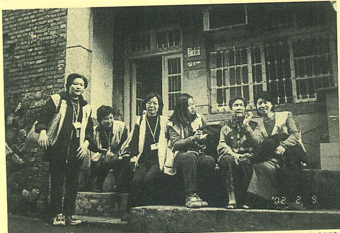
永續就業工程夥伴在重建街訪查過程中對它的人事物建立很深的情誼

這幾天探訪下來，可說是我有生以來最感到新鮮的事，住淡水快20年了，出入老街的次數不勝枚舉，所看到的老房子、老石頭、老柱、老街