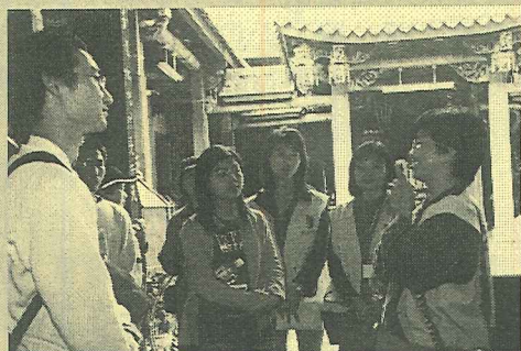
▼永續就業工程文化產業計畫培養導覽解說人才