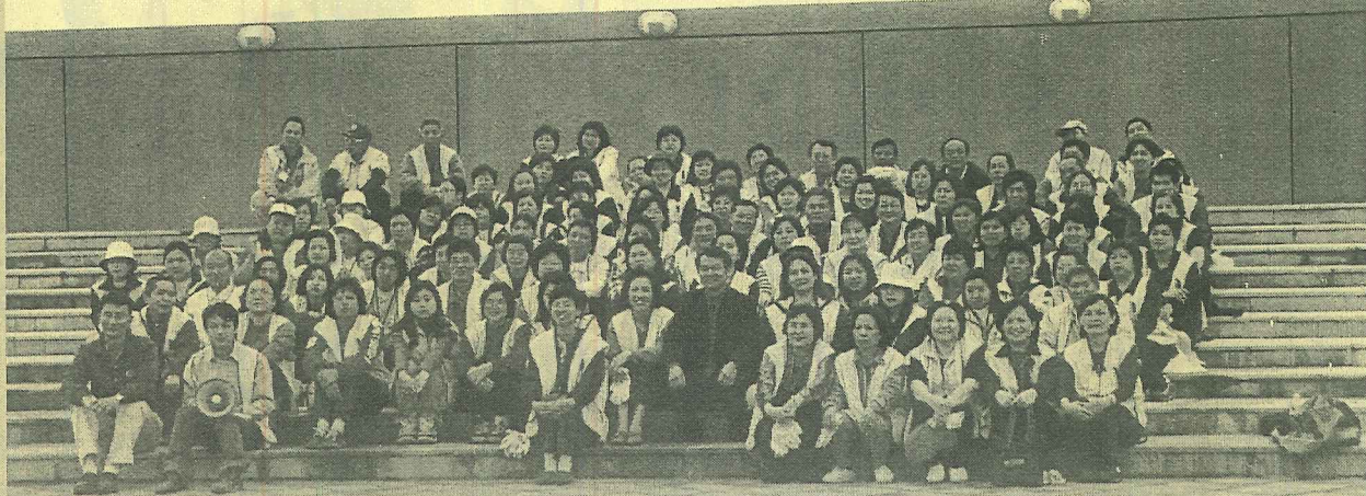
▲淡水文化基金會辦理的永續就業工程計畫，淡水總部工作隊到漁人碼頭淨灘維護環境