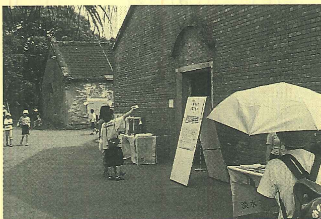
穀牌倉庫園區的建築風貌和歷史故事，將成為未來淡水觀光旅遊重要的一站

稅務司官邸(小白宮)了解整修前的現況，縣府指出目前已完成空間的設計規劃，包括有戶外表演場、室內展覽場、遊客服務等設施，而整個官邸未來呈現的主題內涵應多加充實，近日將動工整修，預定一年半後完工、開放參觀。